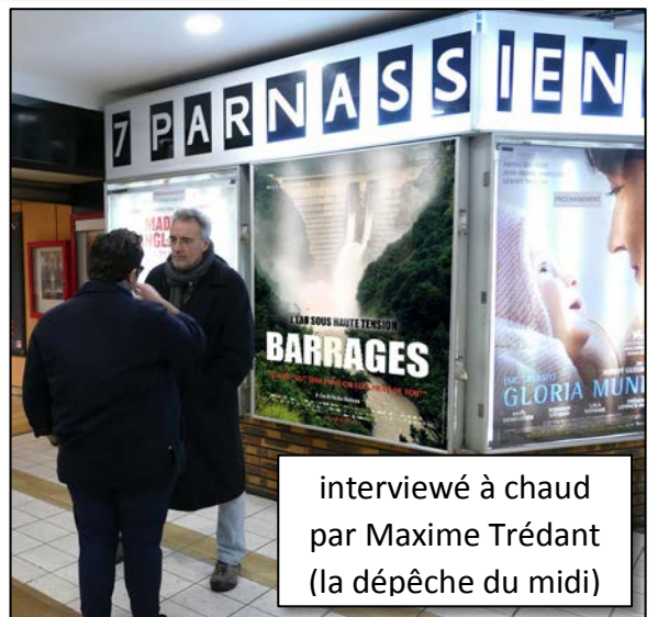
interviewé à chaud par Maxime Trédant (la dépêche du midi)