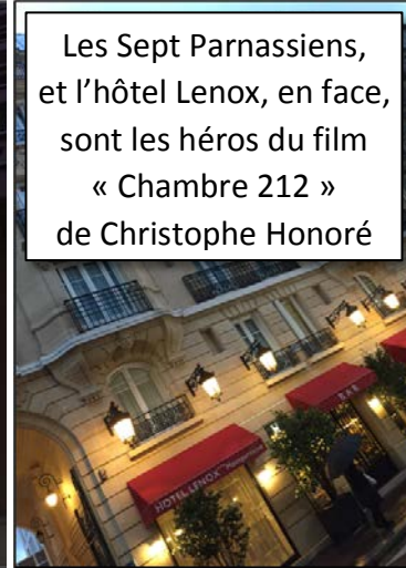
Les Sept Parnassiens, et l'hôtel Lenox, en face, sont les héros du film « Chambre 212 » de Christophe Honoré