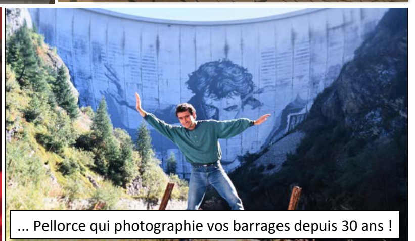
... Pellorce qui photographie vos barrages depuis 30 ans !