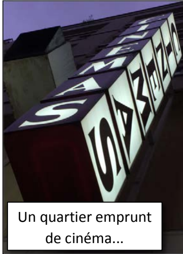
Un quartier emprunt de cinéma...