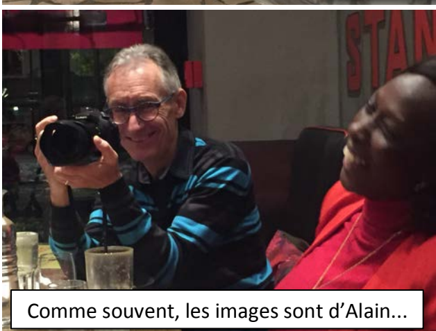
Comme souvent, les images sont d'Alain...