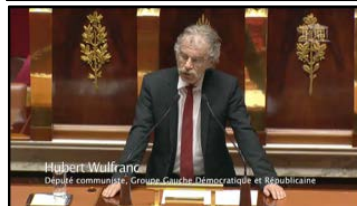
Hubert Wulfranc Député communiste - Groupe Communiste, Démocratique et Républicain