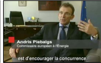
Andris Piebalgs Commissaire européen à l'énergie est d'encourager la concurrence,