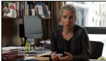
Delphine Batho Députée démissionnaire Ecology Ancienne ministre de l'environnement