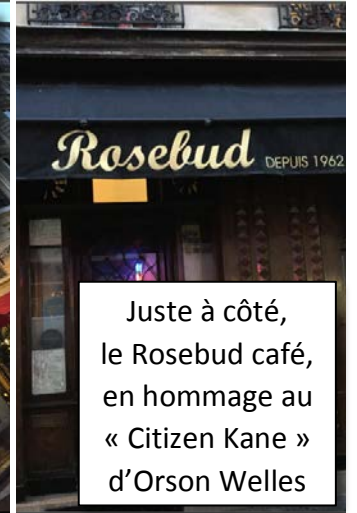
Juste à côté, le Rosebud café, en hommage au « Citizen Kane » d'Orson Welles