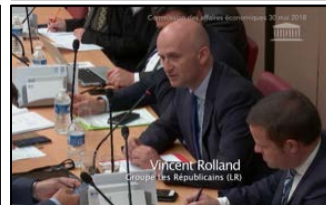
Vincent Rolland Groupe Les Républicains (LR)