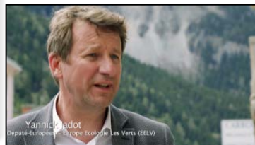
Yannick Badot Député Européen - Europe Écologie Les Verts (EELV)