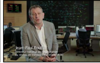
Jean-Paul Roubin Directeur national de l'exploitation du réseau de transport électrique RTE