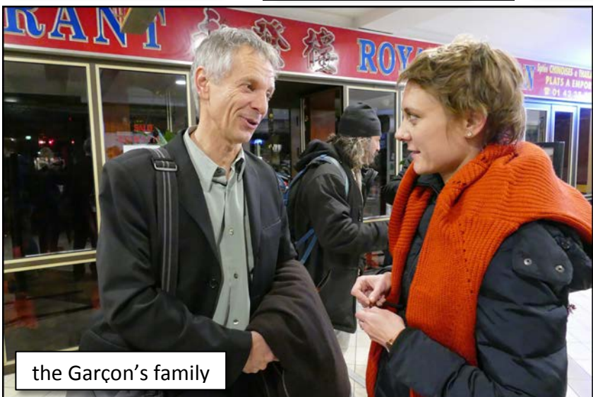
the Garçon's family