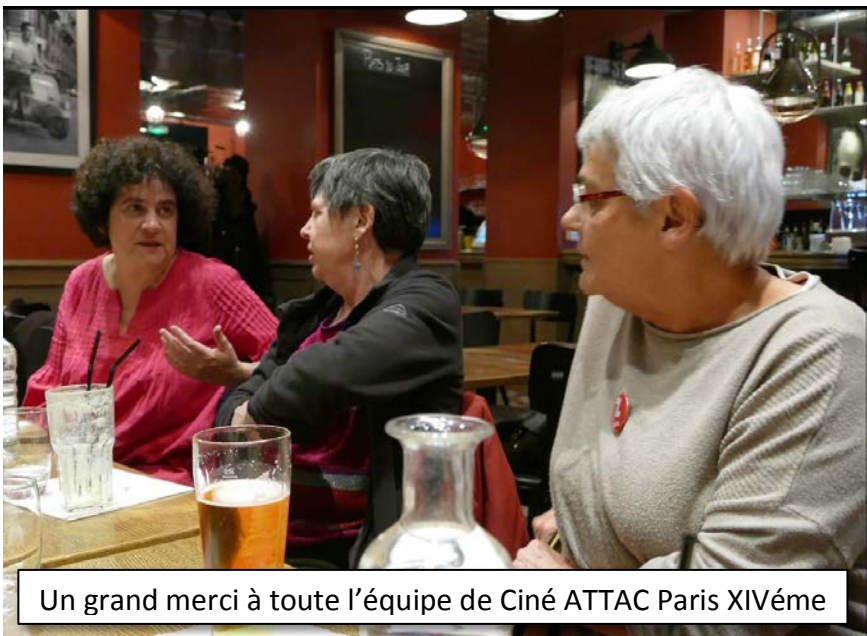
Un grand merci à toute l'équipe de Ciné ATTAC Paris XIVème