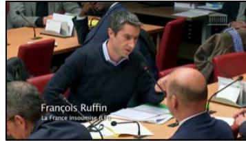
François Ruffin La France Insoumise à Lille